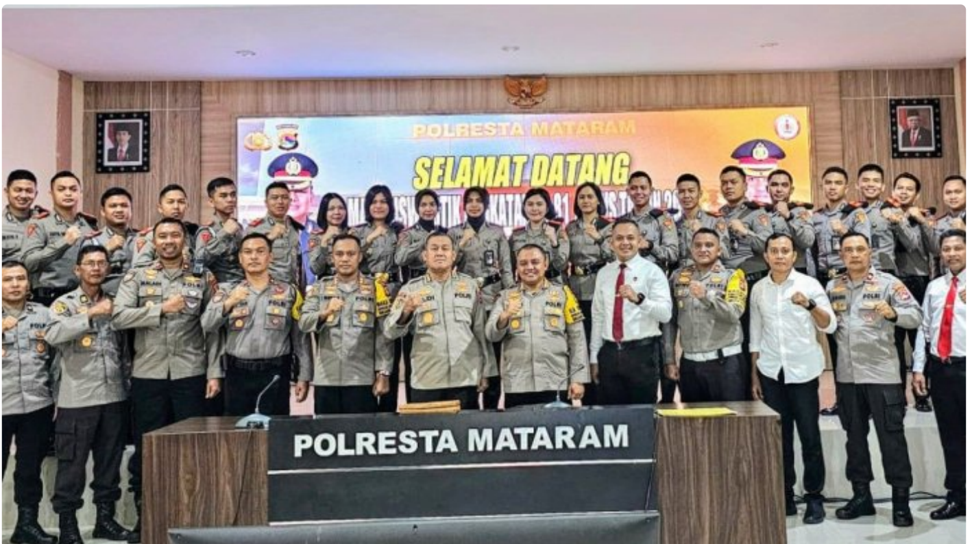
Kapolresta Mataram dan segenap PJU bersama Mahasiswa STIK / PTIK pada acara Penyambutan di Gedung Wira Pratama Polresta Mataram, (17/03/2024)

Mataram NTB - Sebanyak 24 Siswa Sekolah Tinggi Ilmu Kepolisian (STIK) / Perguruan Tinggi Ilmu Kepolisian (PTIK) Lemdiklat Polri Angkatan 81 hadir di wilayah hukum Polresta Mataram dalam rangka pelaksanaan tugas pendidikan yakni Kegiatan Pengabdian masyarakat STIK / PTIK di wilayah Hukum Polresta Mataram.