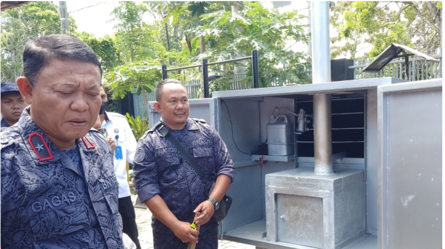
Kepala BNNP NTB saat pemusnahan BB sabu dengan mesin insenerator. (10/11)

Mataram NTB - Menindak lanjuti peraturan perundang-undangan terkait pemusnahan barang bukti narkotika yang disita dari hasil penindakan atas Peredaran gelap Narkotika, Badan Narkotika Nasional Provinsi Nusa Tenggara Barat (BNNP NTB) melakukan pemusnahan Barang Bukti hasil pengungkapan tindak Pidana Narkotika, Kamis (10/11).